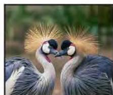
FEBRERO Grulla Coronada