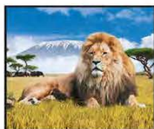
ENERO León Masai