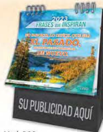
Mod. 302 Frases que Inspiran