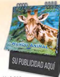
Mod. 303 Mundo Animal