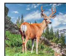
NOVIEMBRE Venado de Cola Blanca