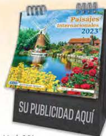
Mod. 301 Paisajes Internacionales

Imagen atractiva y distinción para su negocio