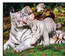
ABRIL Tigre Blanco