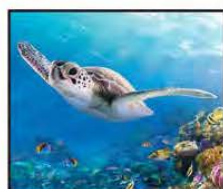
AGOSTO Tortuga Marina