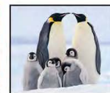
DICIEMBRE Pinguino Emperador